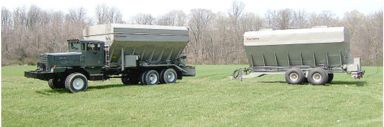
Montados en camion cisterna o Tipo-Remolque

Hidratados, cementados, volcanicos, calcareos, o bentoniticos