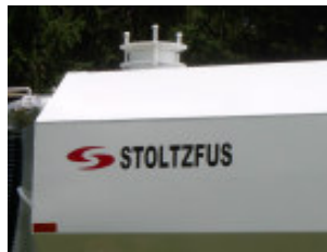
9" de relieve de presion ajustada a 2 psi