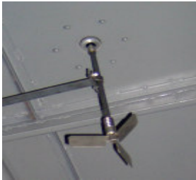
Monitores de compartimiento