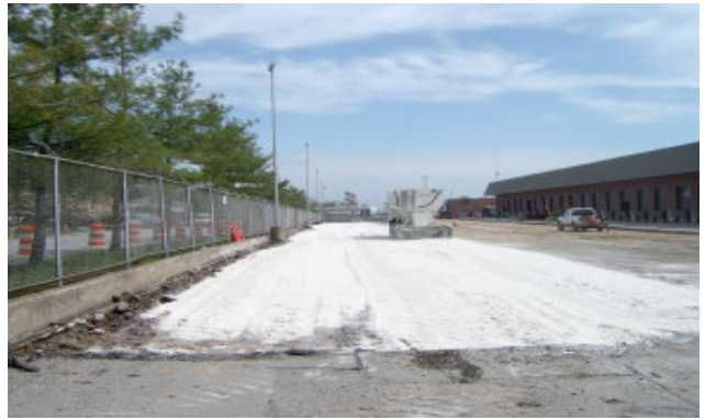
Asperje en areas confinadas con minimo de polvo.