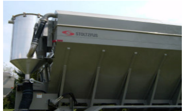
Bidon con filtro remueve el plvo de la ventanilla durante el llenado