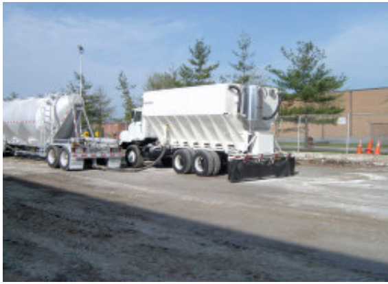
Transfiera cementos a 1 tonelada por minuto sin polvo.